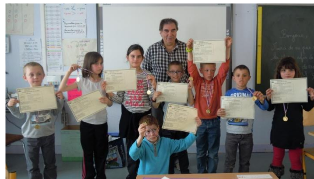
Remise des médailles aux joueurs d'échecs

L'organisation des activités périscolaires regroupées sur le vendredi après-midi relève depuis le 1er septembre 2015 d'un Plan Educatif Territorial (PEDT), contrat signé avec le Préfet et l'Inspecteur Directeur Académique du Rhône et d'un Accueil Collectif de Mineurs (ACM) reconnu par la Direction Départementale de la Cohésion Sociale. Cette reconnaissance a été un véritable défi pour une petite commune rurale comme la nôtre.